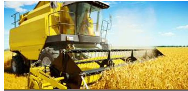
Macchine e attrezzi agricoli