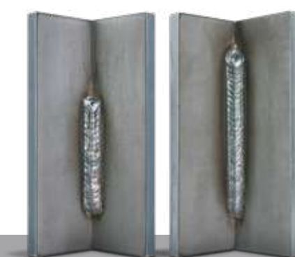
"l'impegnativo verticale" SpeedUp

Aspetto del cordone di saldatura TIG alla velocità MIG-MAG.