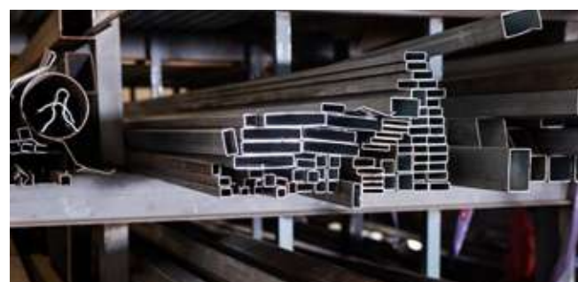
Lavorazione della lamiera