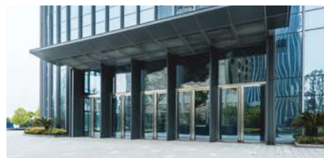
Realizzazione di infissi e facciate