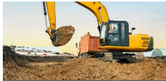
Costruzione di veicoli e macchine edili